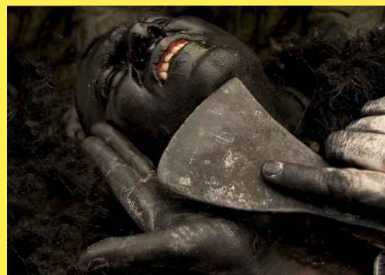
Rasage de l'ours à la fête des Ours en Vallespir, Prats de Mollo, s. d.